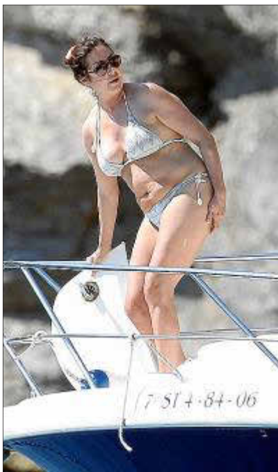
¿Algunos kilitos de más...? ¡No pasa nada!

En fin, que es una pena que se haya ido. Pero, ¡qué le vamos a hacer!