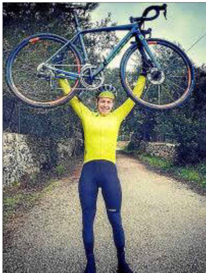
También prepara The Vuelta Ride .