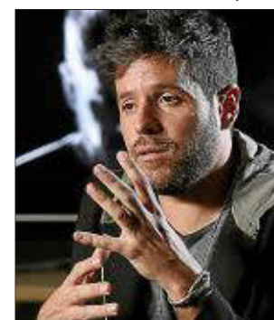
Pablo López llena el aforo.